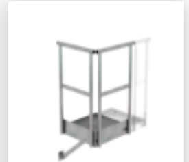
Plate-forme d'extension 500 x 1000 mm