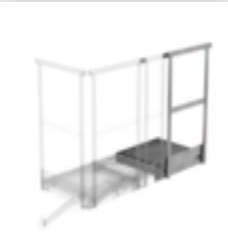
Plate-forme d'extension 400 x 800 mm