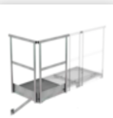
Plate-forme de base 800 x 800 mm