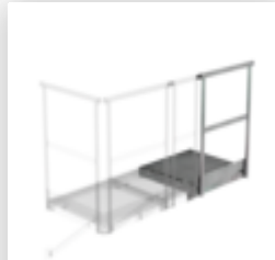
Plate-forme d'extension 800 x 800 mm