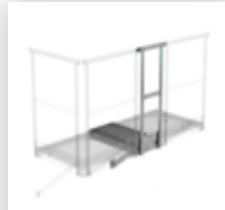
Plate-forme d'extension 1000 x 1000 mm