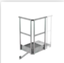
Plate-forme d'extension 500 x 1000 mm