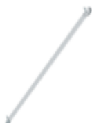
Planche de bordure latérale pour longueur d'échafaudage 1,8 m