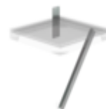
Plate-forme d'extension 1000 x 1000 mm