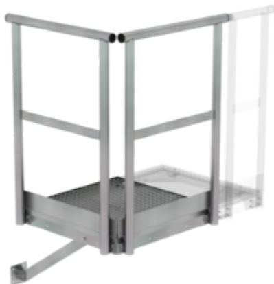
Plate-forme de base 800 x 800 mm