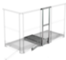
Plate-forme d'extension 800 x 800 mm