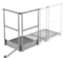
N° de commande: 060950 Plate-forme de base 1 000 x 1 000 mm