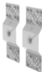
N° de commande: 063278 Support mural