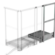
N° de commande: 060943 Plate-forme d'extension 800 x 800 mm