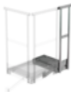
N° de commande: 060941 Plate-forme d'extension 400 x 800 mm