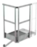
N° de commande: 060942 Plate-forme de base 800 x 800 mm