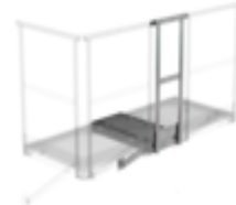
N° de commande: 060952 Plate-forme d'extension 500 x 1000 mm