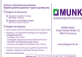
N° de commande: 019007 Plaque signalétique pour dispositif de protection anti-chute pour dispositif anti-chute