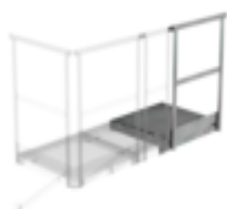
N° de commande: 060951 Plate-forme d'extension 1000 x 1000 mm