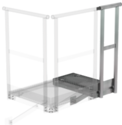
Plate-forme d'extension 400 x 800 mm